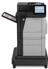
HP Color LaserJet Enterprise M680f Multifunktionsdrucker