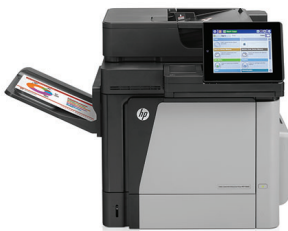
HP Color LaserJet Enterprise M680dn Multifunktionsdrucker

Große Druckvolumen sind mit diesem Hochleistungs-Farb-MFP kein Problem. Drucken und Kopieren sowie Scannen und Faxen. 1 Verbesserte Scanfunktionen und ein 8-Zoll-Farb-Touchscreen sorgen für reibungslose Arbeitsabläufe. Dank mobiler Druckoptionen bleiben Sie auch unterwegs produktiv. 2