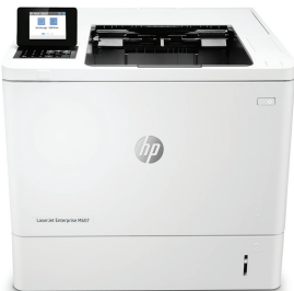
HP LaserJet Enterprise M607dn